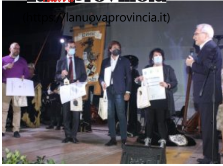
( https://lanuovaprovincia.it/attualita/the-a-academy-successo-per-la-festa-di-inizio-anno-allartom-di-asti/ )