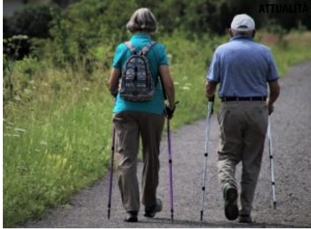
( https://lanuovaprovincia.it/attualita/lasl-at-riattiva-i-gruppi-di-cammino-5-km-unora-di-camminata-almeno-una-volta-a-settimana/ )